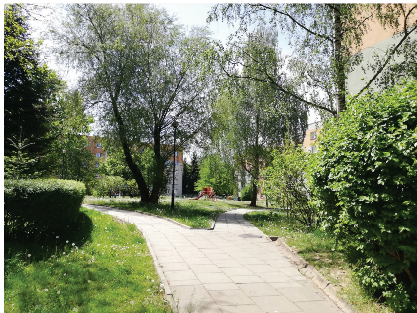
Rys. 4. Jeden z ogrodów dziecięcych na osiedlu Kurdwanów Nowy maj 2020

mieszkańców dalszych rejonów Krakowa nie wie o istnieniu tego miejsca w Kurdwanowie. Mimo dobrej komunikacji nie jest to miejsce ich weekendowej rekreacji czy cel spacerów. Nieliczni krakowianie słyszeli o corocznym festynie Jesień Kurdwanowa – nie wiążą go jednak z kurdwanowską zielenią 2 .