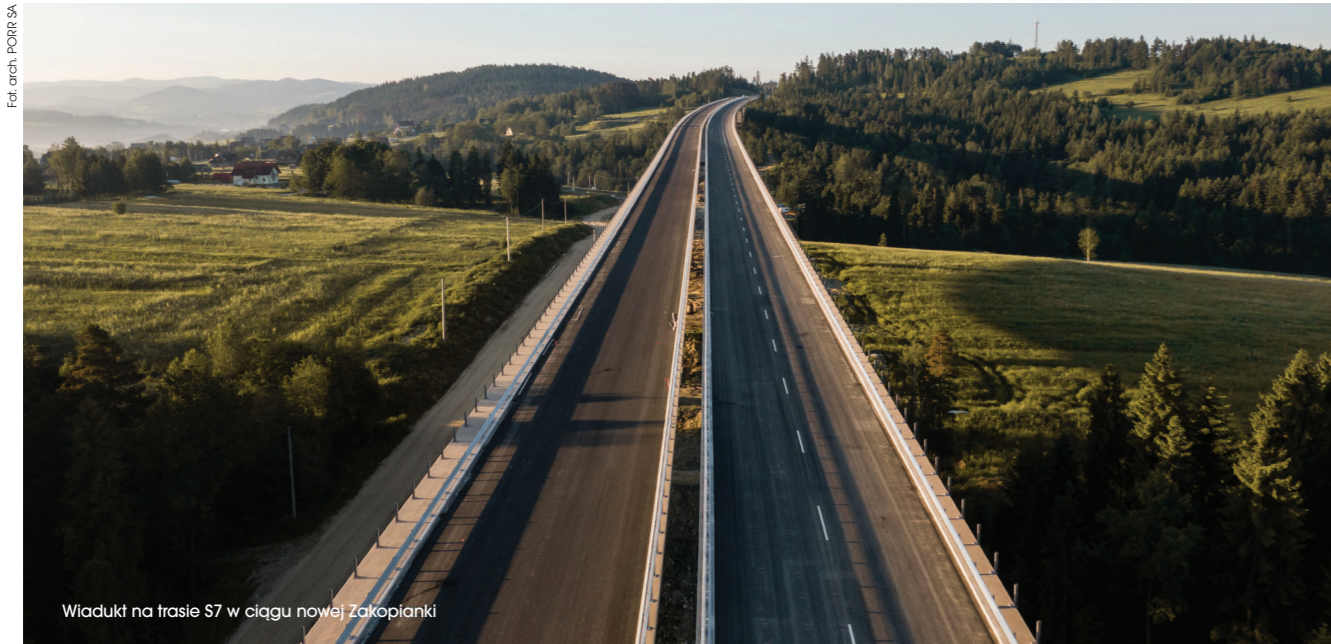
Wiadukt na trasie S7 w ciągu nowej Zakopianki