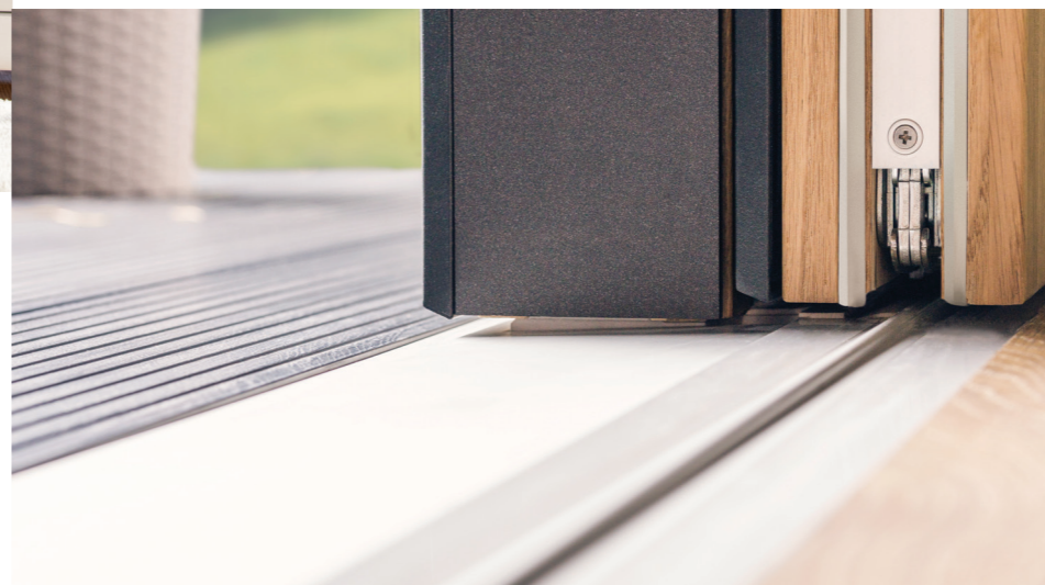
Wózki jezdne zapewniają lekkie przesuwanie skrzydła