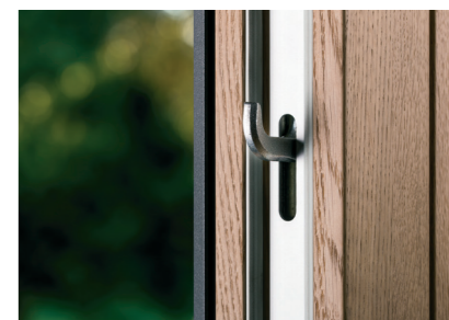
Przy otwartych drzwiach haki całkowicie chowają się w skrzydle co zapewnia elegancki wygląd i zwiększa bezpieczeństwo.

Drzwi tarasowe HST-Sky firmy FAKRO to przykład „szytego na miarę” produktu, który idealnie wkomponuje się w bryłę i charakter budynku, a także spełni wszelkie potrzeby użytkowników. HST-Sky powstają z najwyższej jakości materiałów, które są trwałe, ponadczasowe i piękne. Wraz z firmą FAKRO promujemy dobre, polskie wzornictwo i kulturę materiałową ze świadomym poszanowaniem środowiska naturalnego.