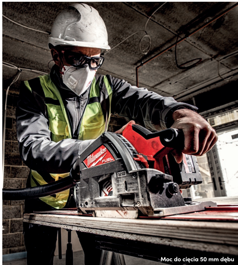
Moc do cięcia 50 mm dębu

Zagłębiarka M18 FUEL™ 55 mm do drewna i tworzyw sztucznych kompatybilna z prowadnicą to wyczekiwana przez profesjonalistów nowość w ofercie MILWAUKEE®.